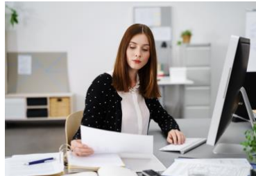
Kaufmann/-frau für IT- System-Management