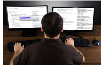
Fachinformatiker/in für Anwendungsentwicklung

Als Fachinformatiker/innen der Fachrichtung Systemintegration installierst und konfigurierst du IT-Systeme (Server, PCs, Dienste und Anwendungen). Als Dienstleister im eigenen Haus oder beim Kunden, richtest du IT-Umgebungen entsprechend der Projektvorgaben ein und betreibst bzw. verwaltest diese. Dazu gehört auch, dass du bei auftretenden Störungen die Fehler systematisch lokalisierst und behebst. Du berätst die Kunden bei der Auswahl und beim Einsatz von Geräten und Lizenzen. Daneben erstellst du Systemdokumentationen und führst Schulungen für die Benutzer durch.